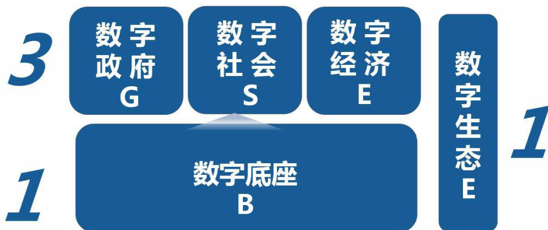
数字福州“131”体系概念图

“1”是数字底座，以打造城市大脑体系和数据流体系为核心，强化数字城市感知侧和行动侧能力，承载互联网、大数据、云计算、人工智能、区块链等新一代信息技术，支持“感知→学习→判断→执行”迭代循环赋能的统一平台。